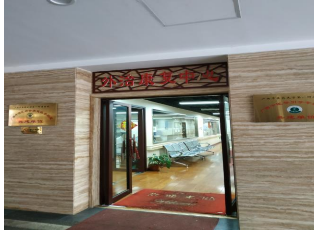
项目一楼外治康复中心