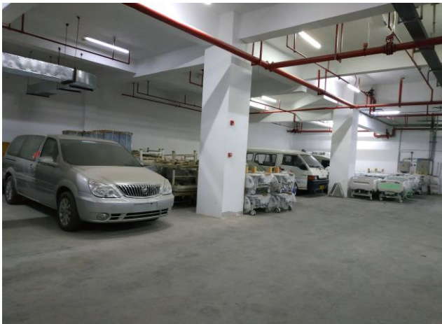
项目地下一层停车场