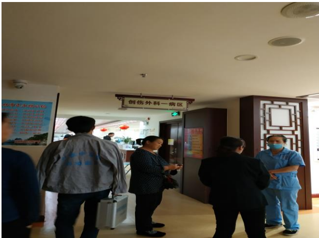
项目二楼创伤外科一病区