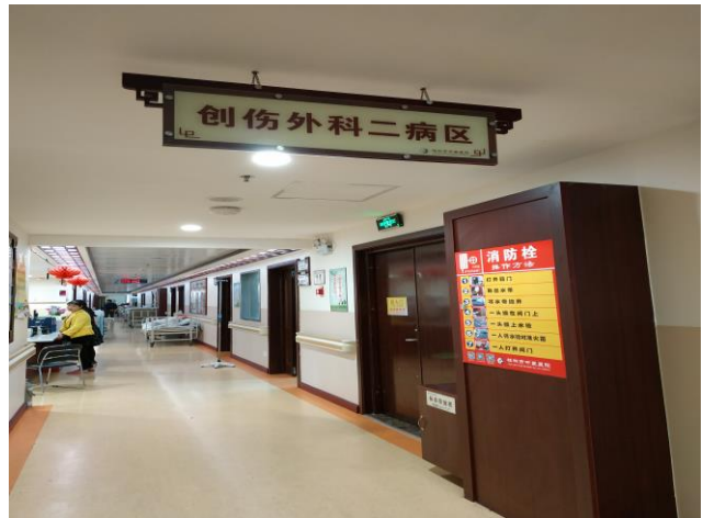
项目三楼创伤外科二病区