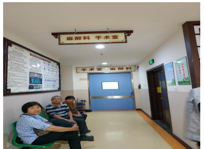
项目七楼麻醉科 手术室