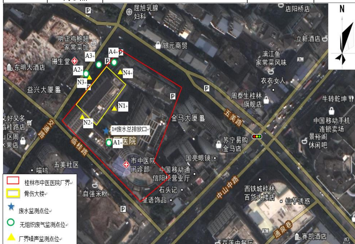
图 7-1 监测点位示意图