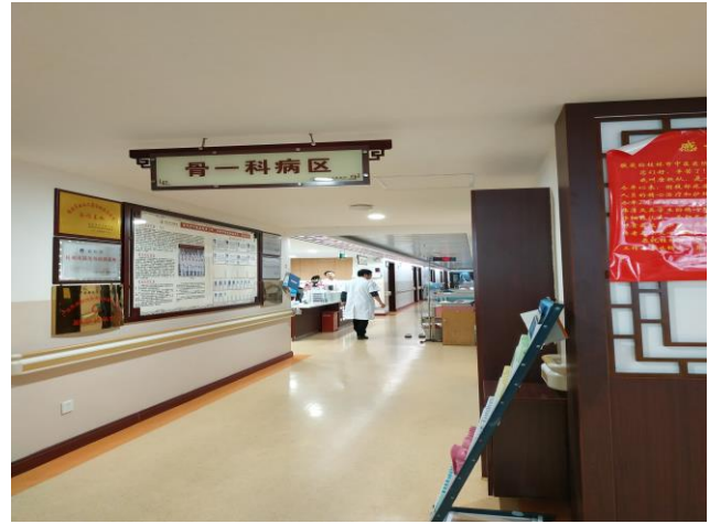
项目五楼骨一科病区