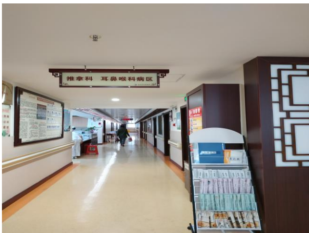
项目六楼推拿科 耳鼻喉科病区