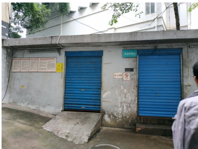
医疗废物暂存点、生活垃圾池