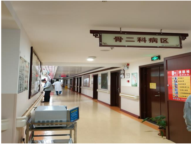
项目四楼骨二科病区